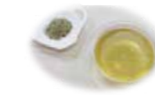
マテチャ葉エキス