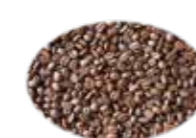
コーヒー種子エキス